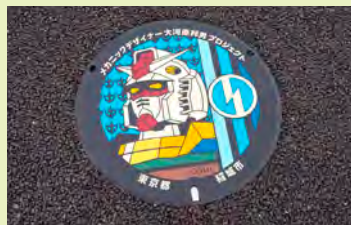
(写真3) 日本初の「機動戦士ガンダムのマンホール」