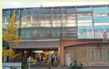
(写真2) 現在の矢野口駅北口