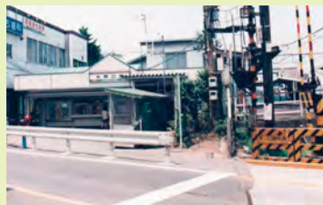
(写真1) 高架化前の矢野口駅舎

稲城市内には、イルミネーションの「よみうりランド」、日本初の「機動戦士ガンダムのマンホール（写真3）」、稲城長沼駅前の「ガンダムとシャア専用ザクの巨大モニュメント（写真4）」、幻の梨「稲城」、サイクリングが楽しめる「多摩川サイクリングロード、南多摩尾根道路」などの三密を回避した屋外観光スポットが充実しています。思い出の尽性園と共に稲城市へ散策にいらしてください。