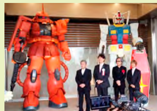
(写真4) 稲城長沼駅前の「ガンダムとシャア専用ザクの巨大モニュメント」

さて、稲城市は市立病院を運営しておりますが、コロナ禍の影響により大変厳しい財政状況となっています。地域の方々の健康と命を守る医療拠点という認識から、私たち市議会は、市立病院への補正予算を可決しました。感染症指定医療機関ではない市立病院が新型コロナウイルス感染症に対応し、診療を続けるための様々な対策を重ねた結果、現在のところ、院内感染「ゼロ」とのことです。改めて最前線で働かれている医療従事者の皆様に