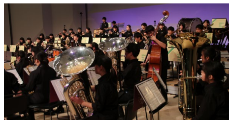
中央上にパーカッション男子

僕らとは3分の2世紀も年の離れた九段中等教育学校の子達。そのラテンだなんてどんなものかなと神興を上げたが、この日は季節外れの大雪。開幕のブザーを聞くまでに疲れてしまった。それが1曲目を聴いた途端、僕らの背や腰がピンと伸びた。初々しい清新な音色、外連味なんて当然ゼロ。とにかく一心に自分達の音を真っ直ぐに吹くことだけ。その姿勢に好感が持てた。曲