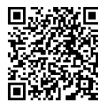
演奏者受付 QRコード

中等現役部員との合同演奏やOB・OGだけのステージを企画しています。久しぶりに楽器を持つ方も歓迎します。ご参加をお待ちしております。