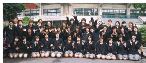
女子がいっぱい!(卒業アルバムより)