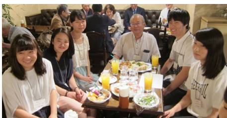
新理事長と新会員 どちらもフレッシュ！