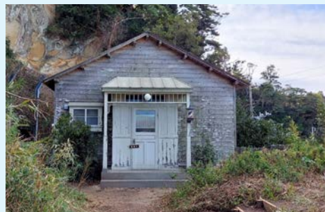
観海亭に設えられた理髪店のセット