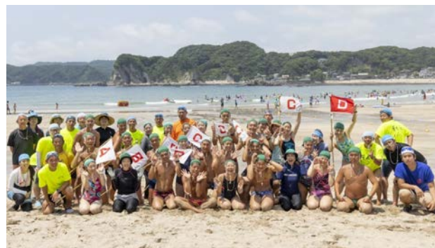
守谷湾に集合した2019年の助手たち

至大荘が、九段生にとって魅力ある行事として続いていくことを願いながら、わたしたち助手はこれからも活動していきます。